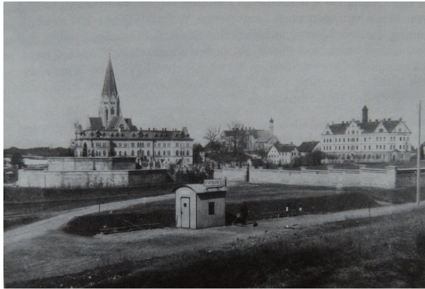
Ottiliensis «locus subsistendi». Aspectus, quem etiam iam anno 1900° praebuit. [Maria HILDEBRANDT (2008), p. 279.]

Ipsa autem ferrivia inter Augustam Vindelicum atque Aburacum 63 denique die 23° m. Dec. a. 1898° definitive atque sollemniter usui tradita est. 64 Quidam ex Ottilianis, inter quos P. Subprior, hanc sollemnitatem tramine vehentes participaverunt, quia - ut chronista hilariter adnotat - hunc in modum monstrare voluerunt «illos habitum gerentes institutionibus modernis non esse infestos». 65