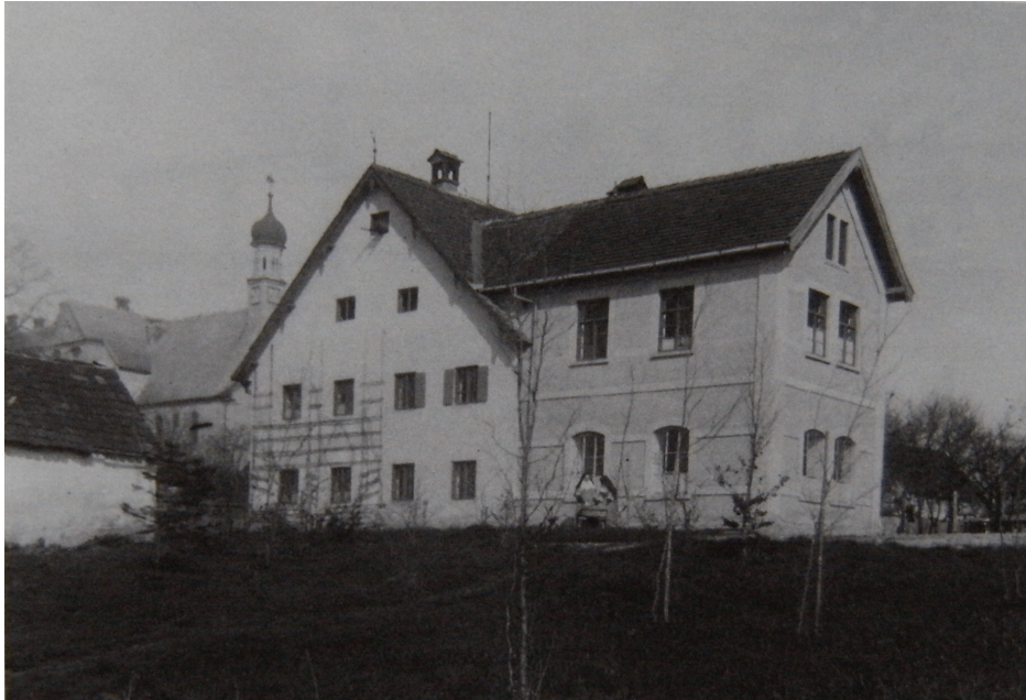
Domus Sanctae Annae anno 1898 o , cum esset domus lavatoria. [Maria HILDEBRANDT (2008), p. 59.]

Circiter duodecim alumni in initio illis in conclavibus versabantur. Hunc in modum oecotrophēum iam condebatur, sed ipsa schola professionalis institui nondum potuit, quia et locus aptus et magistri hac re eruditi deerant. 36 Tamen in primo capitulo generali participes iam postulaverant, ut talis schola necessario institueretur. 37