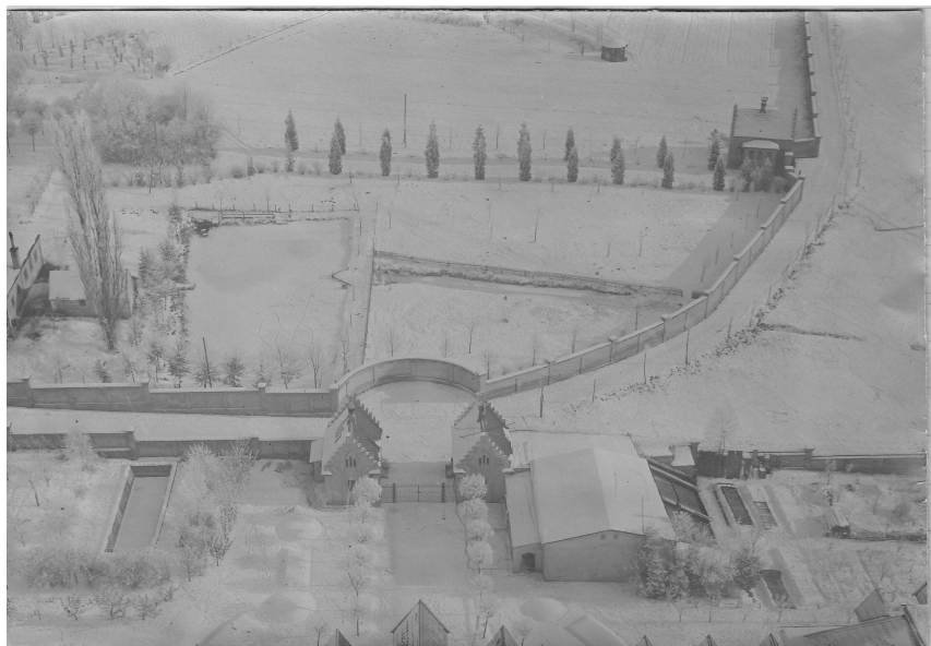
Domūs portariae desuper receptae, unde bene nova aedificii pars adiuncta conspicitur. [Missionsprokura I, p. 2 (ASO, K.8).]